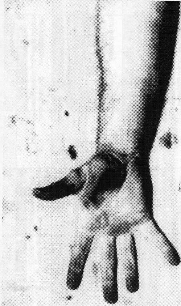
Richard Serra "Hand catching lead"